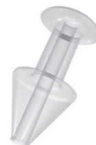
Micro Flow™ Permanente tårepunktplugger. Delvis okklusjon

Alle BVI tårepunktplugger er produsert ved å benytte medisinsk silikon av høyeste kvalitet. Tårepunktpluggene har 92% retensjonsrate, det vil si 92% sannsynlighet for at tårepluggene forblir i tårepunktet etter ett år.