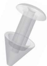
Parasol® Permanente tårepunktplugger. Total okklusjon